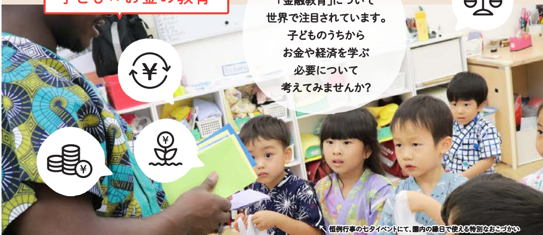
恒例行事の七夕イベントにて、園内の緑日で使える特別なおごころい

これからの時代、社会を生き抜く力を育てるために、ますます金融教育の重要性がうたわれるようになりました。金融教育とは、「金銭」「経済」「投資」などお金に関連する教育を総称して言います。日本の“お金の教育”状況を、世界と比較してみていきましょう。