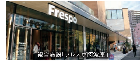
複合施設「フレスポ阿波座」

阿波座は本町や肥後橋に隣接した地域で、これまでオフィス街というイメージが強かったかもしれませんが。ですが近年の都心回帰傾向で、西区は人口増加率においても出生率においても大阪市24区内で上位にランキングされ、子育て世代にとって人気の高いエリアのひとつとなっています。キンダーキッズ阿波座校は駅から徒歩5分程度の便利な立地にあり、近隣にはスーパーやドラッグストア、クリニックモール等からなる「フレスポ阿波座」という複合施設のオープンで賑わいをみせながらも、大きな道路からは一本入ったところに位置し、とても静かな環境です。園のすぐ近くには樹木がたくさん公園があり、園庭・屋上園庭に続く子ども達の遊び場所として活躍が期待できそうです。また木津川の西側の川口は、明治時代に外国人居留地が設けられ「大阪の文明開化の発祥地」と呼ばれた地域で、「大阪の近代教育発祥の地」とされる川口基督教会が今も残るなど、歴史を感じさせる一面もあります。