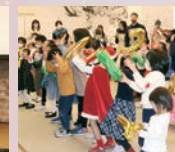
大阪大学外国語学部出身者が創設した劇団による、全編英語のミュージカルを子どもたちが楽しんで参加している姿を見て、すごく誇らしい気持ちになりました。保護者の方も参加できる唯一のイベントでゆっくりお話ができ、私達スタッフもとても嬉しかったです！