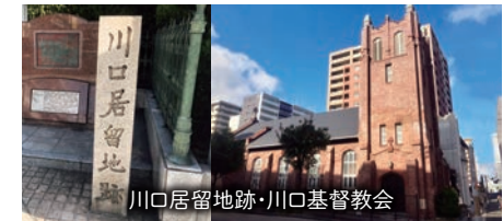
川口居留地跡・川口基督教会