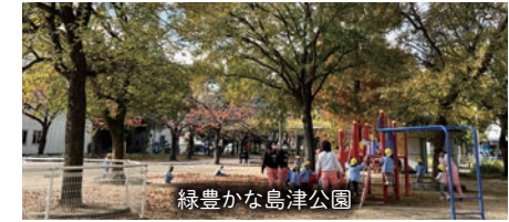
緑豊かな島津公園