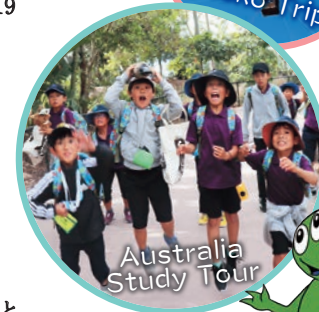
Australia Study Tour